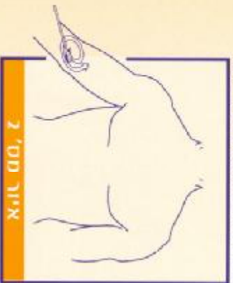
איור מס' 2

הכניסה הפיזיק מתבצעת על ידי צוות רופאים, אחיות ומטנאים המאמינים בנושא. הביצוע נעשה תחת שיקוף רנטגן. המטרה נעשית בהדרגה ממוקדת באמצעות ציוד מתקדם בחלק הפנימי של החרוץ הנחתת. מטרתה את אישור הסליקו לתוך הורד ברזל עתידה אל הורד המרכזי. חתך זה יסגור על ידי תפירתו. על-מנת למנוע זרימה לא רצויה (היפלטום) של הצנתר, הוא יקובע אל חופן החרוץ באמצעות תכשיטה שיחודת או תפר. (ראה איור מס' 2).