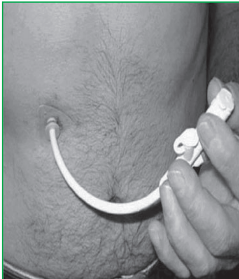
פג - צינור ההזנה כפי שהוא נראה לאחר הכנסתו לקיבה. כאשר הפג אינו נמצא בשימוש ניתן להדביקו עם סרט דביק לעור וכך למנוע את תזוזתו

ההזנה דרך הפג ניתנת בפרקי זמן קצובים כך שבין שעות ההזנה ניתן להמשיך לתפקד כרגיל.