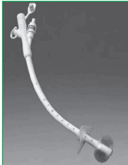
פג - צינור ההזנה כפי שהוא נראה לאחר הכנסתו לקיבה